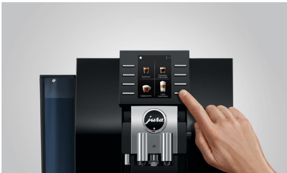
Überarbeitetes Bedienkonzept mit hochgestelltem 3,5 Zoll-Farbdisplay, acht Tasten und künstlicher Intelligenz