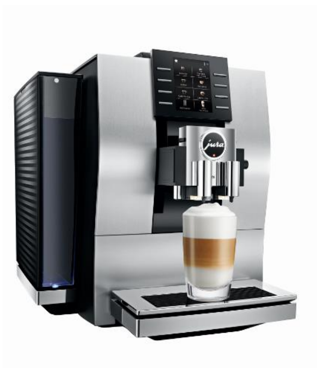
JURA Z6 in neuem Design und spannenden Farbvarianten, wie hier in edlem Aluminium